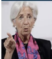
Christine Lagarde (Directora del Fondo Monetario Internacional)

"Los ancianos viven demasiado y eso es un riesgo para la economía global. Tenemos que hacer algo, y ya!"